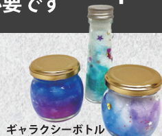
ギャラクシーボトル