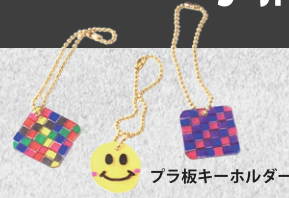
プラ板キーホルダー

えさし郷土文化館 Esashi Native District Cultural Museum