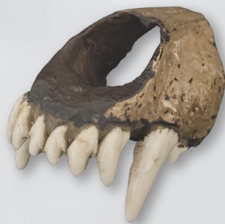
ニホンオオカミ頭骨(上顎) 個人蔵(えさし郷土文化館収蔵)