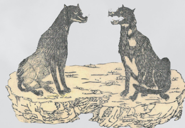
山犬画像(抜粋) 館蔵