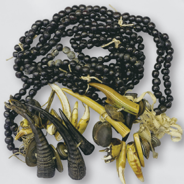
イラタカ数珠(イタコ数珠) 個人蔵